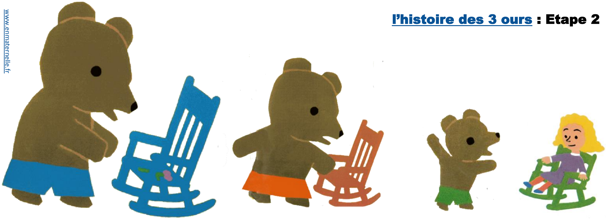
chaises pour papa ours, maman ours et bébé ours