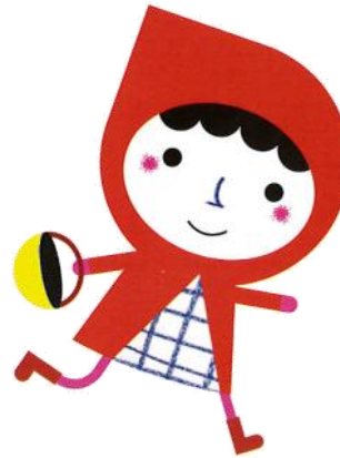
LE PETIT CHAPERON ROUGE