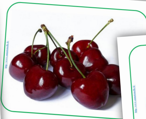
DES CERISES des cerises des cerises