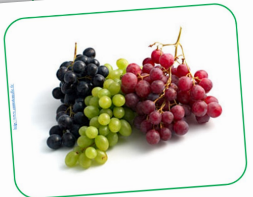
DU RAISIN du raisin