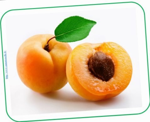
UN ABRICOT un abricot un abricot