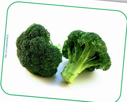
DES BROCOLIS des brocolis des brocolis