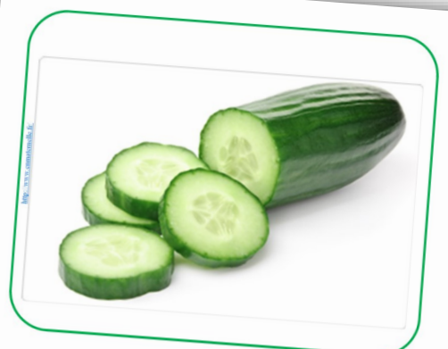
UN CONCOMBRE un concombre un concombre