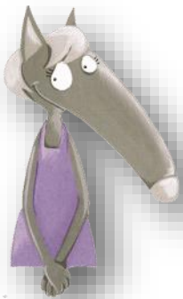
LOUVE Louve Louve