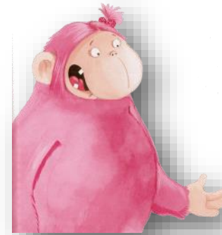
DEMOISELLE YETI Demoiselle Yéti Demoiselle Yéti