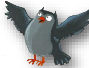
MAITRE HIBOU Maitre Hibou Maitre Hibou