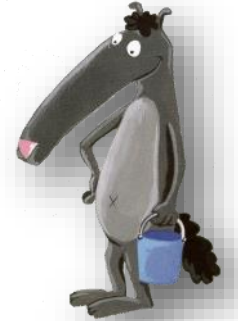
JOSHUA Joshua Joshua