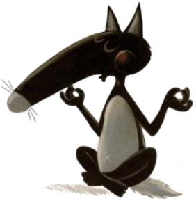
LOUP Loup Loup