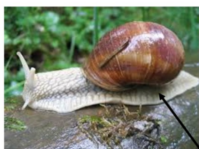
UN PIED D'ESCARGOT un pied d'escargot un pied d'escargot