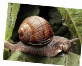
UN ESCARGOT un escargot un escargot